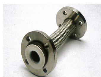
(雙固定金屬網法蘭)