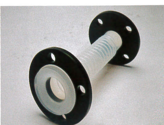
(活動式金屬法蘭噴塗ECTFE)